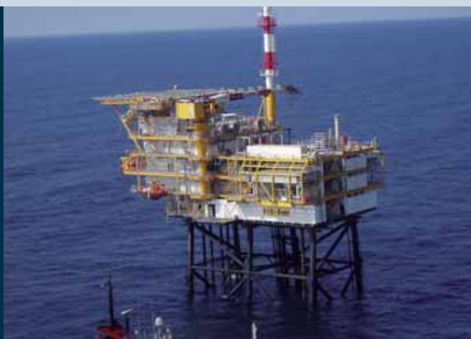
Het nieuwe F16-A platform (Wintershall).