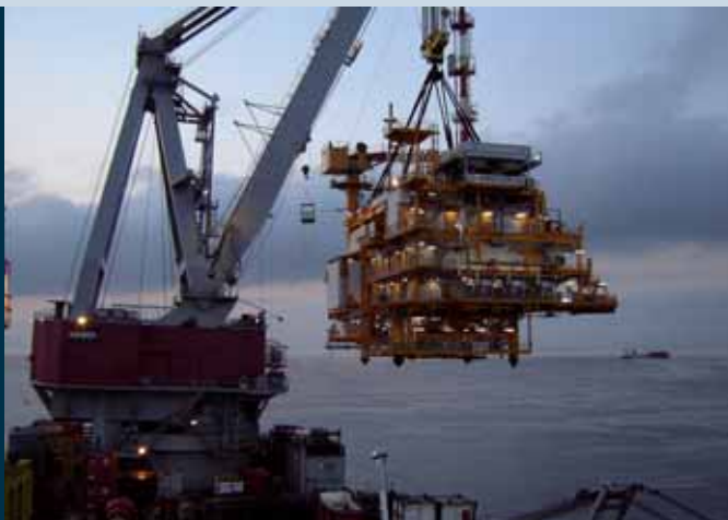
Het G17d-AP platform (Gaz de France) in de takels.