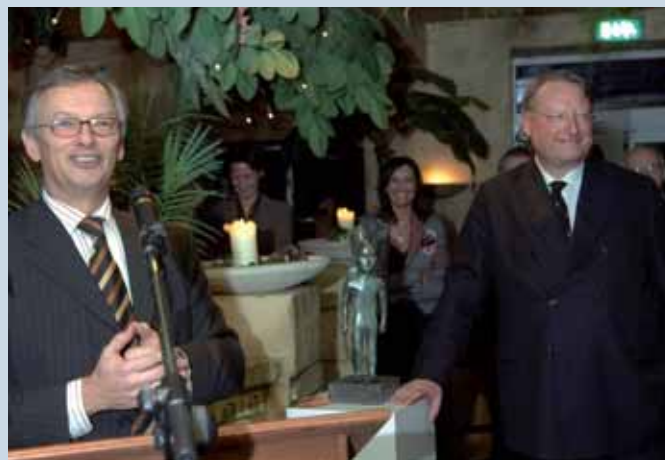
Afscheidsbijeenkomst DSM/EBN op 6 januari 2006.

Per 1 januari heeft EBN een nieuwe governance. Belangrijk onderdeel daarvan is de per zelfde datum benoemde Raad van Commissarissen, welke volgens de statuten evenals de directie wordt benoemd door de Aandeelhouder. Omdat de activiteiten van EBN gericht zijn op het realiseren van het energiebeleid van de Staat, waarvoor de Minister van Economische Zaken de verantwoordelijkheid draagt, is in statuten ook opgenomen dat EBN in zijn handelen zich daarnaar te richten heeft. Mocht dit niet het geval zijn heeft de minister de bevoegdheid om een aanwijzing te geven. Bij de inrichting van de governance is mede bepalend het deelnemingenbeleid van de Staat waarin onder meer opgenomen is het uitgangspunt dat de Code Tabaksblat wordt gehanteerd. Voor EBN is met de aandeelhouder overeengekomen dat 2006 een overgangsjaar is waarbij zoveel mogelijk al relevante elementen van de code worden toegepast.